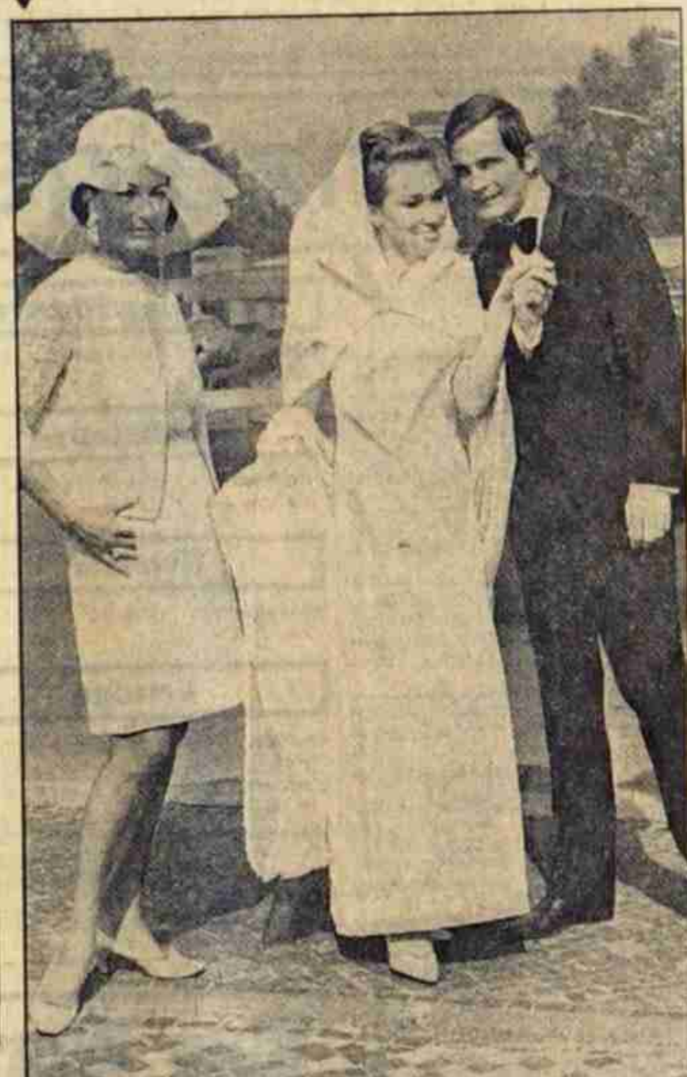
Süß und jung ist das Modell „Berlin“, das Heidi hier vorstellt. Material: St. Gallener Spitzen. Ebenso jugendlich ist der Anzug des Bräutigams. Fotos: Lilo Frank, Anzüge: Norberts Boutique

Auch die Mama darf am Hochzeitstag der Kinder jugendlich gekleidet sein. Hier trägt sie ein rosafarbenes Spitzenkleid.