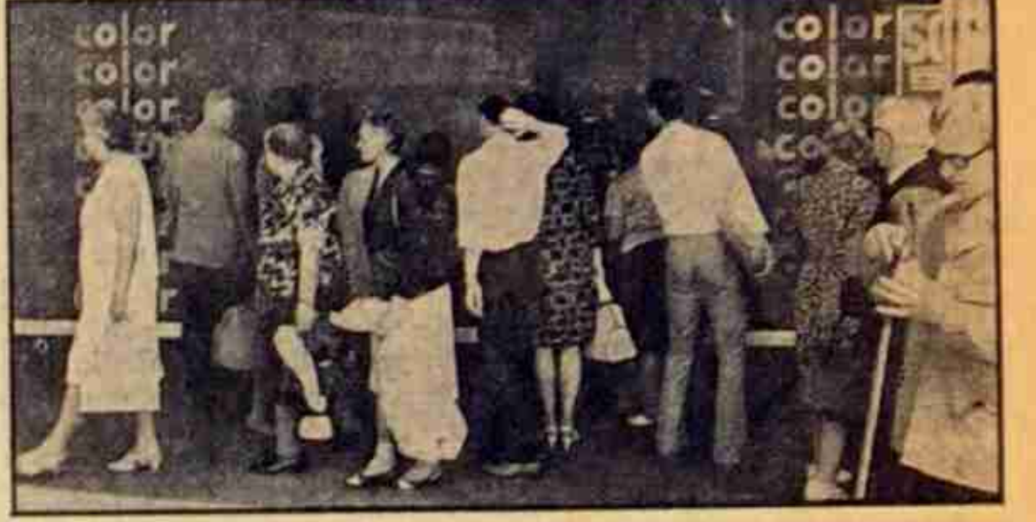
Umlagert: Schaufenster mit Farbfernsehern

einen guten Schwarz-Weiß-Empfänger hatte, kann die gleiche Antenne für einwandfreie Farb-Qualität benutzen.“ Bei einer Testvorführung im SFB konnten sich Journalisten gestern von der bestehenden Echtheit der Fernseh-Farben beeindrucken lassen. Die Töne sind klar, natürlich und nicht knallig, sie können je nach Geschmack um Nuancen verändert werden. Bis zum 24. August müssen sich die stolzen Besitzer eines Farbfernseh-Gerätes noch mit der Freude an Testbildern, Dias und Kurzfilmen begnügen. Am 25. August mit dem Beginn der 25. Großen Deutschen Funkausstellung fällt dann der offizielle Programm-Startschuß für die bunte Mattscheibe. Auf der Ausstellung können sich die Bildschirm-Freunde, die der Farbe noch nicht so recht trauen, selbst ein Bild machen: In der „Fernsehstraße“ werden zahlreiche Geräte die Farbsendungen ausstrahlen. Alle Veranstaltungen der Funkausstellung sind natürlich auch in Schwarz-Weiß zu empfangen.