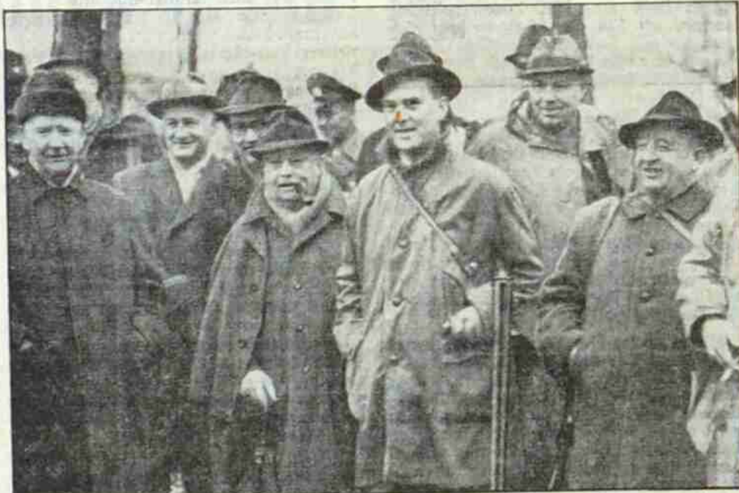
Die traditionelle Diplomatenjagd fand gestern im Geisterholz bei Oelde in Westfalen statt...